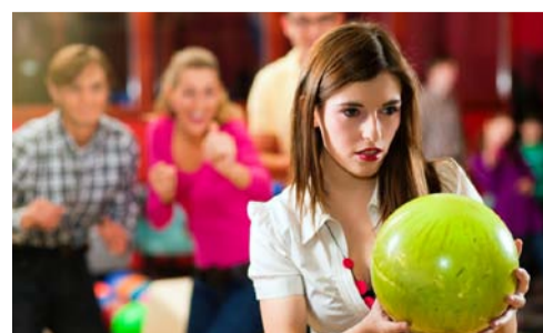
Ein gemeinsames Bowlingspiel kann genauso viel positive Spannung unter Mitarbeiterinnen und Mitarbeiter bringen, wie ein Golfturnier. Und dazu immer wieder Zeit für einen Schwatz.

Firmenevents können sich aufdrängen oder auch von innen heraus inszeniert sein. Sie drängen sich auf, wenn es darum geht, für etwas zu dan-