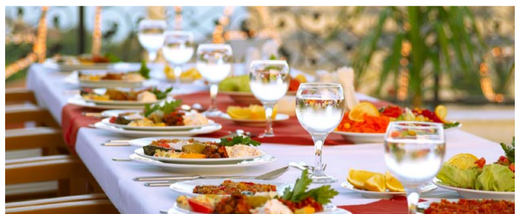
Gemeinsam miteinander zu speisen ist für viele Menschen ein traditionelles und damit wichtiges gesellschaftliches Ereignis.

ken (gute Geschäfte, neue Kunden) oder etwas zu feiern (Jubiläen, neue Gebäude) oder sie werden inszeniert, wenn «wieder mal sowas fällig» wäre. Die Rede ist hier vom Tag der offenen Tür, ein Forum mit hochkarätigen Referenten oder einfach ein gemütliches Zusammenhocken. Ziel muss