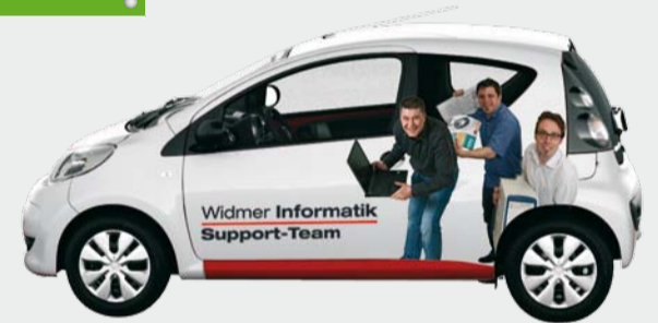
Dieser Citroën lässt keine Frage offen, wer da jetzt unterwegs ist.