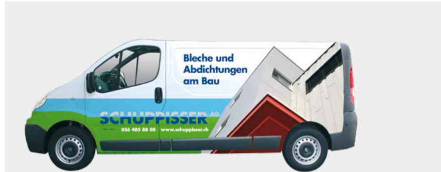
Bei diesem Renault und der Baustellenblache sieht man schnell, dass es da um ein und das gleiche Unternehmen geht.