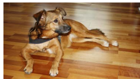
Huch – wer ruft da nach mir – was steht Dringendes an?