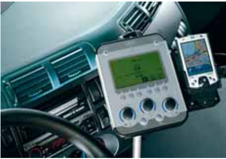
«Autologic», das GPS-unterstützte Arbeitsinstrument zu Schmidt-Wintergeräten der Robert Aebi AG.

nisse werden für unser ganzes, 600 km langes Luzerner Strassennetz über 52 Wetterstationen, die wiederum direkt mit Meteo Schweiz verbunden sind, 24 Stunden im Voraus auf ein halbes Grad Celsius genau gemessen.» Aus dem Ergebnis resultiert bei Bedarf das Arbeitsaufgebot per SMS für Mensch und Maschine, dabei werden die Fahrzeuge direkt programmiert und anschliessend überwacht. Wenn früher ein Chauffeur während seinem Einsatz jede einzelne Arbeit manuell quittieren musste, macht das heute der Computer. Er muss eigentlich nur noch antreten, den Schlüssel drehen und dorthin fahren, wo er vom GPS hingeführt wird.