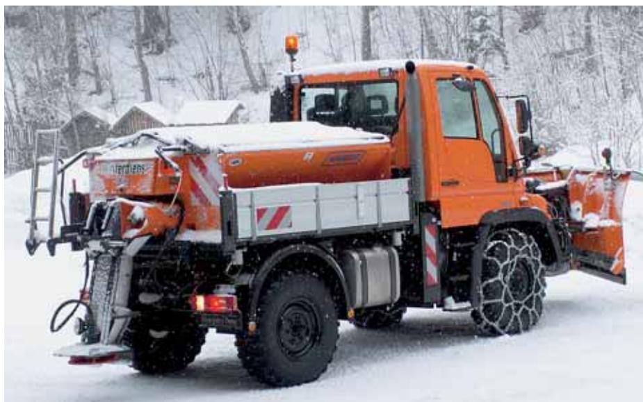
Winterdienst à la carte: GPS-gesteuert und überwacht als Beweis und für die absolute Kostenwahrheit.

Ein Werkhof beispielsweise, der eine wahrheitsgemässe Kostenkontrolle über seinen Fuhrpark führen will oder gar für andere Gemeinden oder Private als «Lohnunternehmer» im Dienst ist, kann dank GPS auf einfachste Art und Weise exakt zurückge-